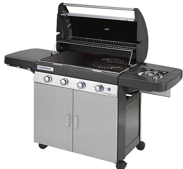
4 SERIES CLASSIC LXS