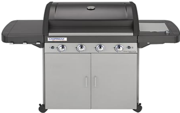
4 SERIES CLASSIC LS 4 SERIES CLASSIC LS PLUS