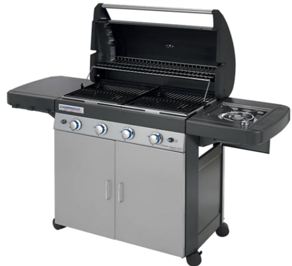
4 SERIES CLASSIC LS G