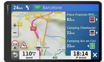
Das Vioo Infotainment-System bietet Camper-spezifische Routenführung und weitere Garmin Navigationsfunktionen.

München, 20. Juli 2020 – Mit dem Vioo 752, Vioo 852 und Vioo 1052 stellt Garmin eine Serie integrierter und dennoch mobiler Infotainment-Systeme für Freizeitfahrzeuge vor. Die Geräte vereinen Camper-spezifische Garmin Navigation mit Fusion Premium-Entertainment und bieten via optionaler EmpirBus-Technologie die Möglichkeit zur Steuerung und Überwachung von integrierten Bordsystemen. Das System besteht aus dem RV 52 Stereo Dock Einbauelement (fahrzeugspezifisch, ähnlich Doppel-DIN), welches das ausgewählte Display (Vioo 752, 852 oder 1052) aufnimmt und mit dem Fahrzeug vernetzt. Außerhalb der Docking Station fungiert das Display als Fernbedienung für die via EmpirBus angeschlossenen Bordsysteme.